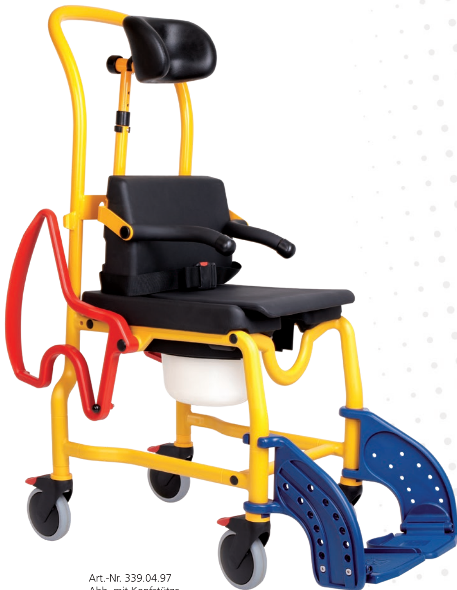
Art.-Nr. 339.04.97 Abb. mit Kopfstütze mit Sitzbreiten- und Tiefenanpassung