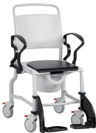
Art.-Nr. 343.10.22 Auch mit Hygieneausschnitt lieferbar!