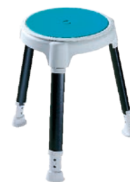
TAYO B-protect rund inkl. Drehteller und Pad