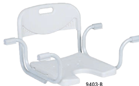
9403-B Mit Rückenlehne