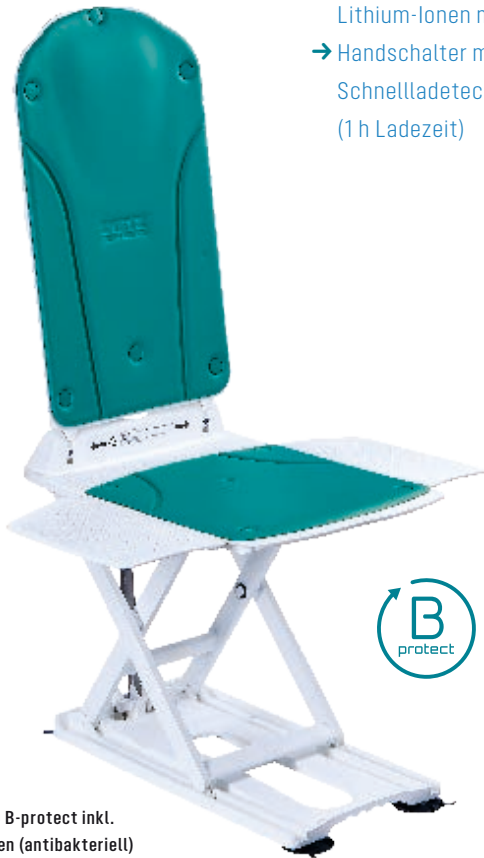
KANJO B-protect inkl. Bezügen (antibakteriell) in Aquamarin