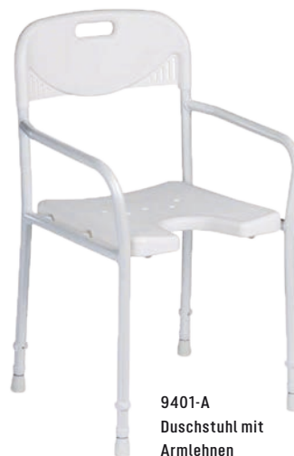
9401-A Duschstuhl mit Armlehnen