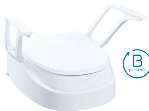
SmartFix B-protect mit Armlehnen

Die neue Produkt-Technologie » B-protect « mit Polygiene BioMaster™ bietet zusätzlich das Plus an Hygienesicherheit .