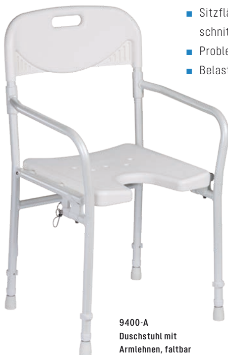
9400-A Duschstuhl mit Armlehnen, faltbar