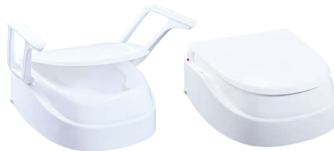
SmartFix mit Armlehnen

Die neue Produkt-Technologie » B-protect « mit Polygiene BioMaster™ bietet zusätzlich das Plus an Hygienesicherheit .