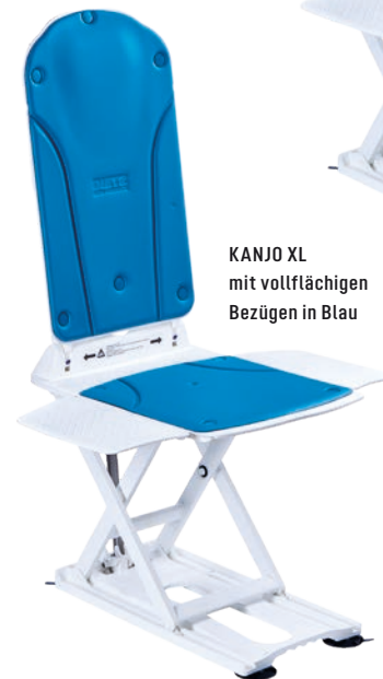
KANJO XL mit vollflächigen Bezügen in Blau