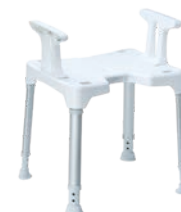
Hocker mit Armlehnen