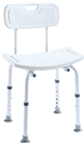
TOMTAR DS Duschstuhl, höhenverstellbar