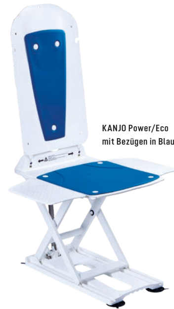
KANJO Power/Eco mit Bezügen in Blau