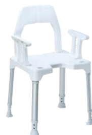
Stuhl mit Armlehnen