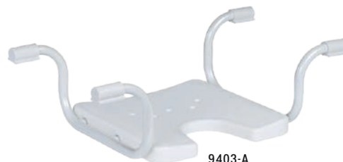
9403-A Ohne Rückenlehne

Ganz nach Ihrem Format: Ergonomische Badewannensitze mit Hygiene-ausschnitt zur Verringerung der Wannensitztiefe bieten Ihnen bequemes und sicheres Badevergnügen.