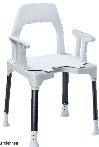
Stuhl mit Armlehnen und Sitzpad (optional)

Die neue Produkt-Technologie »B-protect« mit Polygiene BioMaster™ bietet zusätzlich das Plus an Hygienesicherheit.