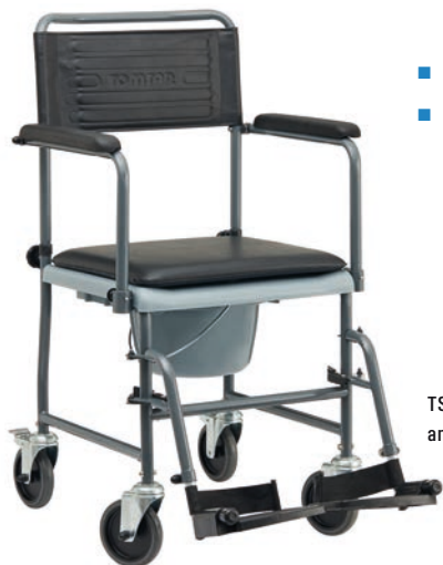
TSU-2, mit Feststellbremsen an den beiden Hinterrädern