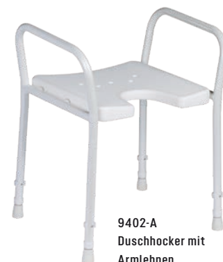
9402-A Duschhocker mit Armlehnen