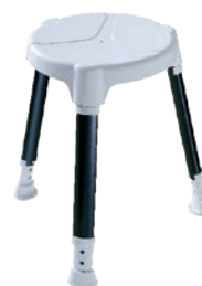
TAYO B-protect rund

Kompaktes Maß, hochsicherer Stand: Der »TAYO« Duschhocker rund ist eine zuverlässige, stabile Unterstützung bei der täglichen Körperhygiene. Wahlweise mit Drehteller inklusive Softpad für noch mehr Komfort.