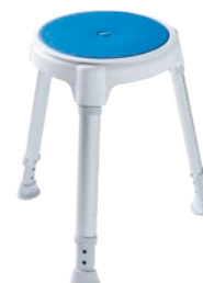
TAYO rund inkl. Drehteller und Pad