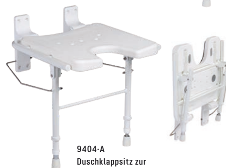
9404-A Duschklapsitz zur Wandmontage, faltbar