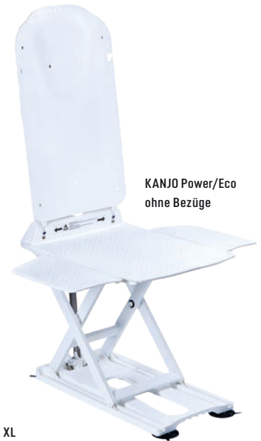
KANJO Power/Eco ohne Bezüge